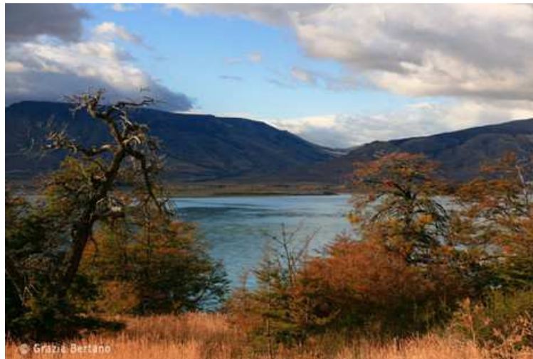
Una fotografia di un lago argentino

Sabato 29 gennaio presso la Sala del Consiglio in Comune