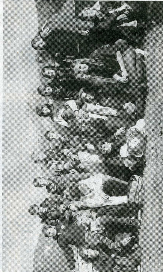
LA SCUOLA «MONSIGNOR ANDREA FIORE» DI CUNEO A DIGNE-LES-BAINS. SOTTO: LA MEDIA DI PAESANA

scambio fa parte infatti del progetto finanziato dall'Unione Europea Alcotra Educazione promosso dalla provincia di Cuneo e dalla Regione Piemonte con la collaborazione pedagogica dell'Alliance Française di Cuneo. La seconda parte dello scambio avverrà nel mese di aprile del prossimo anno quando le scuole francesi saranno ospiti del loro partner italiani. Una mostra con le immagini dello scambio e un DVD elaborato dalle classi stesse verranno a coronare tutto il progetto. Sul versante francese partner della Provincia di Cuneo è il Co-sneil Général des Alpes de Haute Provence che con il Rectorat coordina l'avanzamento del progetto che prevede tra l'altro l'installazione di sistemi di video conferenza per permettere una comunicazione globale e rapida fra le scuole. (Servizio anche alla pagina di Beinette, 19). [m. v.]